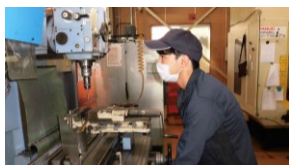
浜松情報専門学校卒