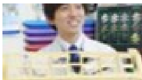
愛知工業大学 経営情報科学部卒