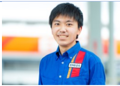
常葉大学 外国語学部卒

■入社年度 2021年 ■所属部署 鳥之瀬SS ■職種 サービスステーションスタッフ