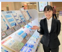
浜松学院大学 現代コミュニケーション学部 卒