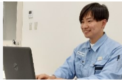
早稲田大学 基幹理工学部卒